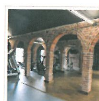
Formulario de reserva