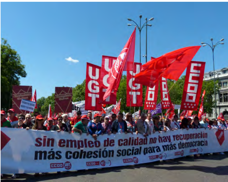
Miles de personas se han manifestado en Madrid contra la política económica del Ejecutivo

Convocada por los sindicatos UGT y CCOO miles de personas han participado en la manifestación del 1 de mayo en Madrid, que este año ha llevado por lema "Sin empleo de calidad no hay recuperación. Más cohesión social para más democracia" y en la que los principales reclamos de los participantes han sido el cambio de la actual política económica y el rechazo a la pérdida de derechos laborales.